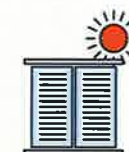
Je ferme les volets et fenêtres le jour, j'aère la nuit