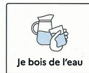
Je bois de l'eau