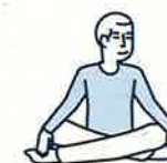
Je fais des activités sans effort