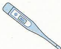
Fièvre > 38°C