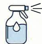
Je mouille mon corps