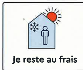
Je reste au frais