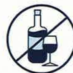
J'évite de boire de l'alcool