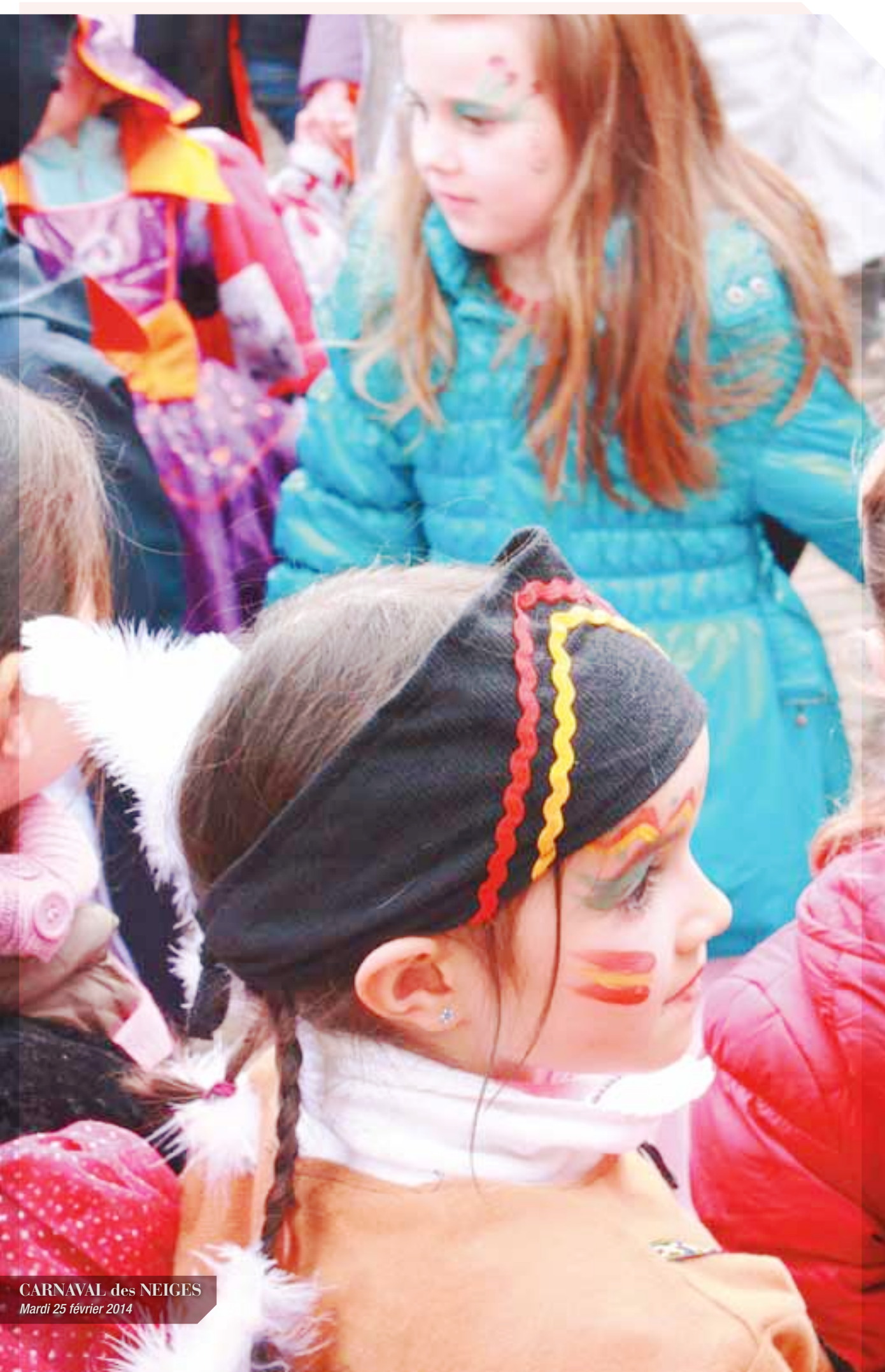
CARNAVAL des NEIGES Mardi 25 février 2014