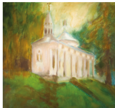
La Scala Santa (huile)