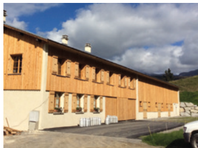
Alpage du Chevan avant et après les rénovations