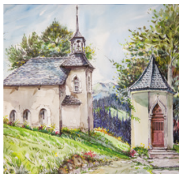
Petit oratoire à côté de sa grande sœur (aquarelle)