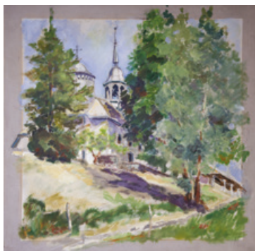
Promenade depuis ma palette jusqu'au Calvaire (acrylique)