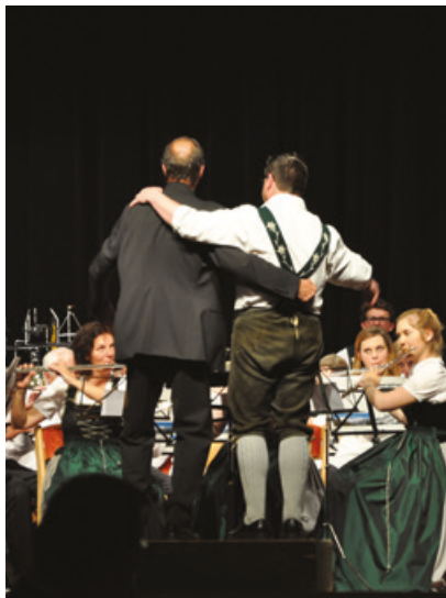
(Musiciens de l'OHM de Megève et d'Oberstdorf)