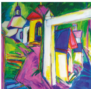
Éveil sur le Calvaire de Megève (huile sur toile)