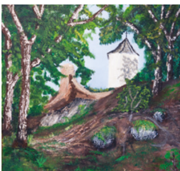
La chapelle du Dépouillement dans la forêt (acrylique)

Nous vous donnons rendez-vous en 2016 pour une nouvelle édition du concours de peinture avec un tout nouveau thème. Informations à venir dans un prochain numéro. ●