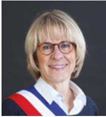
Catherine JULLIEN-BRÈCHES Maire de Megève